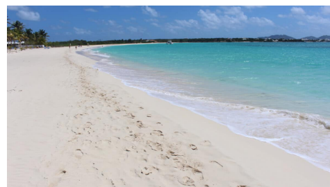
Spiagge di Anguilla