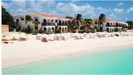
Carimar Beach Club

Il Carimar ricorda l'Anguilla di una volta: semplice, intima e direttamente sulla Meads Bay. Si tratta di ville in stile villette con cucine complete, balconi all'aperto e spazio a sufficienza per vivere. Non si tratta solo di soggiornare qui: ci si trasferisce per una settimana. Le famiglie lo adorano. Così come le coppie che desiderano tranquillità e una spiaggia da cartolina. È sempre stato uno dei migliori rapporti qualità-prezzo nei Caraibi. Da Provare: l'area barbecue fronte mare permette di grigliare pesce fresco a pochi passi dalle onde.