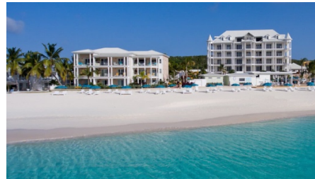
Manoah Boutique Hotel

Manoah Boutique Hotel Shoal Bay East è la stella, e The Manoah è uno dei suoi fiori all'occhiello. Bianco audace, balconi in vetro e camere che vi condurranno direttamente sulla spiaggia. Trascorrete le vostre mattine passeggiando nella baia, i pomeriggi a bordo piscina con un drink in mano e le serate al ristorante sulla spiaggia ammirando il cielo illuminarsi di rosa e oro.