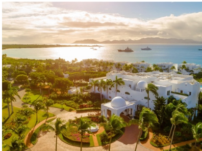
Aurora Anguilla Resort & Golf Club

1° Aurora Anguilla è un continuo crescendo. Questo lo ha reso il numero uno tra i migliori hotel di Anguilla. Non si soggiorna solo qui: ci si arriva. Aurora è una rivisitazione di dimensioni e serenità, che si estende su centinaia di ettari nella baia di Rendezvous, con uno splendido campo da golf di Greg Norman come giardino e una fattoria idroponica che produce i prodotti per la cena. È qui che si trascorre la mattinata nelle acque curative della spa e la sera in una sala degustazione gestita da uno chef con vista sull'oceano. Questo resort continua a migliorare, tanto da essere posizionato al primo posto nella guida ai migliori hotel di Anguilla del Caribbean Journal. Degno di nota: Il campo da golf che è uno dei più belli, in assoluto. E il parco acquatico: difficile da battere se si viaggia con la famiglia.