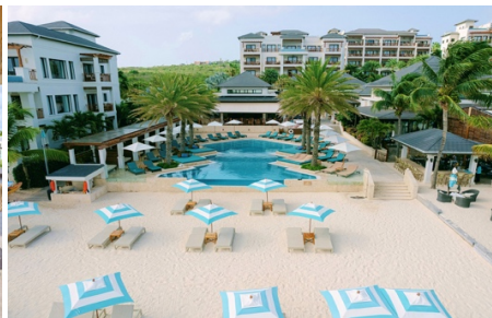
Zemi Beach House, LXR Hotels & Resorts

Zemi Beach House L'hotel fa parte della catena LXR Hotels. Allo Zemi il benessere è l'anima dell'esperienza. Qui troverete l'unica spa in stile thailandese dei Caraibi, una struttura di 300 anni che sembra essere stata trasportata da Chiang Mai e calata sulla Shoal Bay. A completare il tutto, il rum bar, la piscina a sfioro fronte mare e le suite con vasche da bagno che si aprono sull'oceano. Da non perdere: la piscina vitality della Zemi Thai House Spa, circondata da bambù e vapore, è unica nella regione.