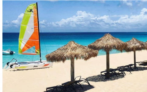
Frangipani Beach Resort

Frangipani Beach Resort È un tratto di spiaggia splendido e un delizioso boutique hotel. Sembra di essere in un angolo privato della Meads Bay, perché al Frangipani è esattamente così. Con solo 19 camere e suite, questo gioiello boutique offre un'intimità rara, persino ad Anguilla. L'atmosfera è elegante e raffinata, il servizio è personalizzato e la spiaggia è proprio Meads Bay, una delle migliori dei Caraibi. Ci si sveglia con il suono delle onde, si va a piedi nudi a fare colazione e si perde la cognizione del tempo su un'amaca a bordo piscina. Ancora meglio? Il ristorante in loco, Straw Hat, è tra i migliori di Anguilla, un'affermazione audace per un'isola con un così forte pedigree culinario. Da provare: la barca privata del resort,