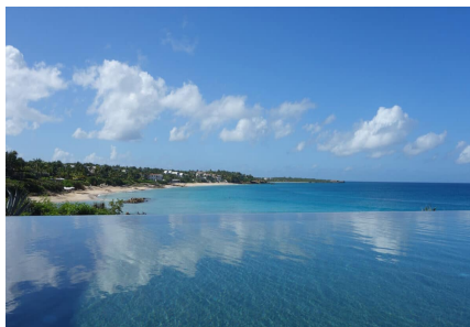
Piscina a sfioro del Four Seasons ad Anguilla