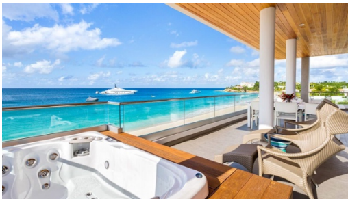
Attico del resort Tranquility Beach

Tranquility Beach Questo è il lusso a piedi nudi con la L maiuscola. Tranquility Beach è tutto design pulito e accesso diretto a Meads Bay. Non sono semplici suite: sono residenze chiavi in mano con cucine gourmet, ampie terrazze e maggiordomi sulla spiaggia che conoscono il cliente per nome dal secondo giorno. Da non perdere: le vasche idromassaggio sul balcone privato dell'attico, praticamente una piscina privata con vista sulla spiaggia.