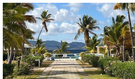
Anguilla Great House

Anguilla Great House Beach Resort Situato sulla Rendezvous Bay, l'Anguilla Great House sfoggia un fascino retrò in stile caraibico. I cottage, decorati con decorazioni in pan di zenzero, sono a pochi passi dalla spiaggia. Nessuna pretesa: solo giornate in spiaggia, punch al rum e una leggera brezza che filtra dalle persiane. Niente di lussuoso. È proprio questo il punto. Ecco com'era l'isola prima che la parola "lusso" prendesse il sopravvento. È un luogo a conduzione familiare, molto amato, dove si vive davvero l'isola. Degna di nota: la Rendezvous Bay. Le spiagge non possono essere più belle di così.